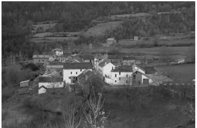
Imagen de Fraxen

Desde el Grupo Municipal de CHA en el Ayuntamiento de Torla pedimos la moratoria de las recalificaciones puntuales y clamamos por un Planeamiento Urbano racional y consensuado por los vecinos. Queremos pueblos vivos y no urbanizaciones camufladas en ampliaciones del casco urbano que sólo generan población de fin de semana, de lo contrario se perderá para siempre aquel lugar que un día logró atraer miradas, cautivar, enamorar y hacer soñar a generaciones de montañeses.