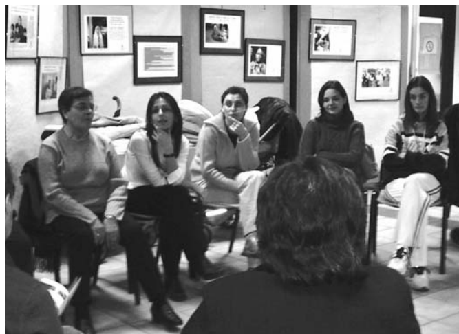
Charla sobre lactancia celebrada durante la Semana de la Mujer. Al fondo, parte de la exposición sobre la situación de la mujer en el mundo cedida por Amnistía Internacional