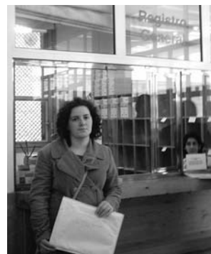
Momento de la entrega de firmas en el Registro

Tras el verano de 2004, los Ayuntamientos de Pina de Ebro, El Burgo y Quinto aprobaron mociones presentadas por CHA pidiendo el segundo pediatra para esta zona de salud, lo que pone de manifiesto que estamos ante un tema importante que nos preocupa a todos y al que hay que dar una solución. A las molestias para las familias, tanto a nivel personal como laboral, generadas por los desplazamientos se suma la inexistencia de un transporte público desde los pueblos que pertenecen a la citada área de Salud hasta el municipio de Fuentes. A pesar de todas estas iniciativas y de la unanimidad de los partidos políticos y de los habitantes de los pueblos afectados, el Gobierno de Aragón no parece dispuesto a solucionar el problema. Desde CHA seguiremos intentándolo.